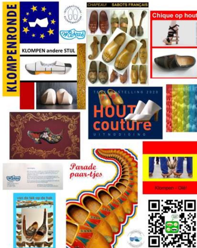
Klompemuseum 1990 - 2020